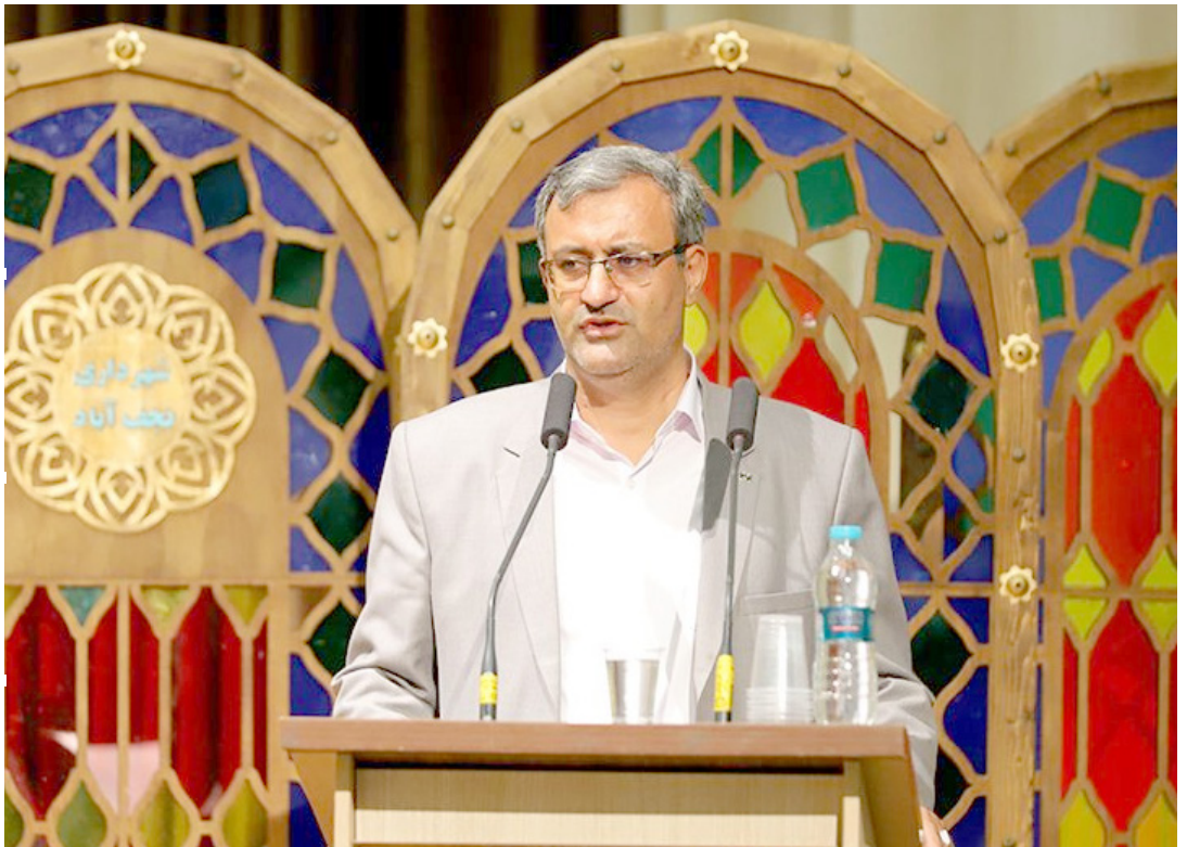
ادامه در صفحه ۲

تکریم و معارفه رئیس آموزش و پرورش نجف آباد