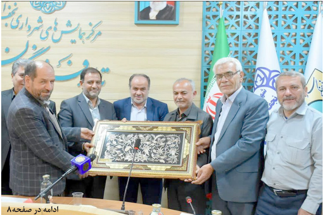
ادامه در صفحه ۸