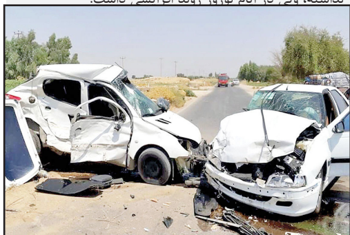
نداشته، ولی در ایام نوروز روند افزایشی داشت.

به گفته سرهنگ بهرام‌پور تصادفات منجر به فوت در مسیرهای درون‌شهری کاهش یافته و امسال حادثه‌ای در این حوزه نداشته‌ایم و حوادث منجر به جرح نیز ۱۶ درصد کاهش داشته است. نظارت‌های پلیس در جاده‌های این شهرستان افزایش یافته و همین عملکرد به افزایش دستگیری سارقان و قاچاقچیان مواد مخدر منتج شد.