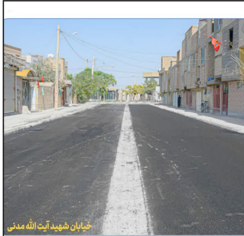
خیابان شهید آیت الله مدنی

گام پنجم پروژه های عمرانی شهرداری گذشت عملیات زیرسازی، جدول گذاری، کانوگداری، پیاده روسازی و آسفالت معابر سطح شهر گذشت