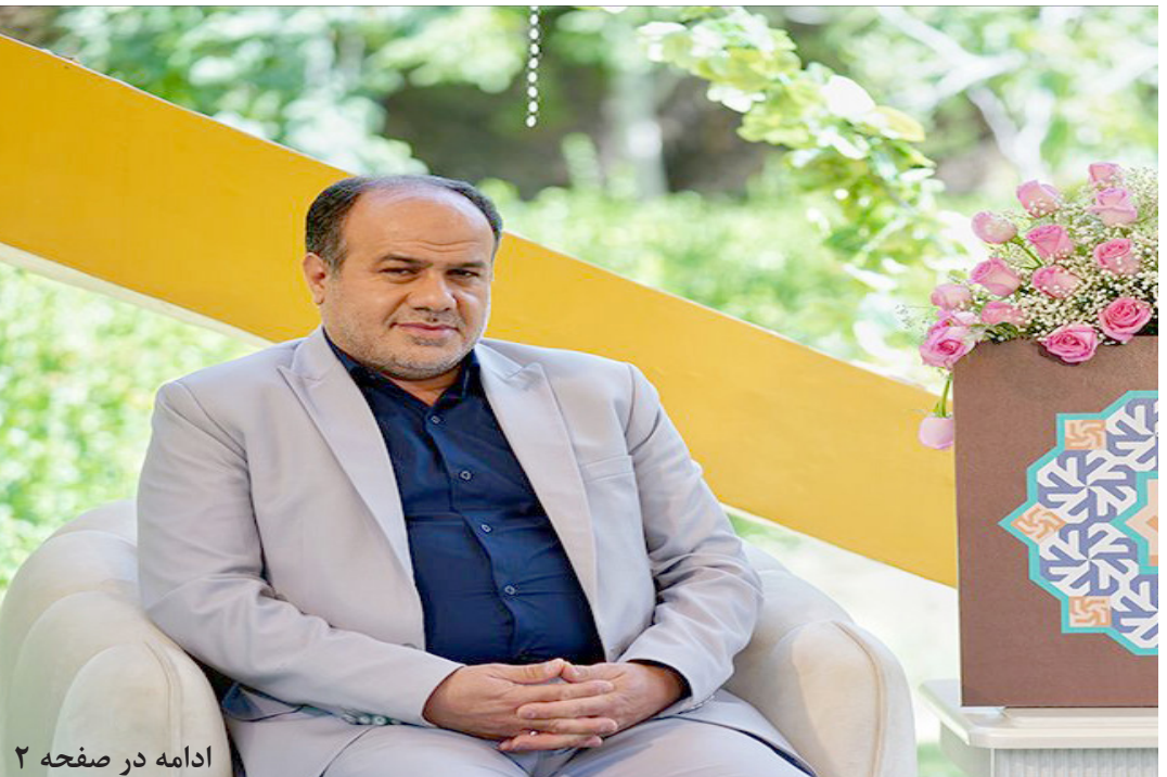
ادامه در صفحه ۲