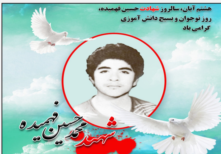
هشتم آبان، سالروز شهادت حسین فهمیده، روز نوجوان و بسیج دانش آموزی کرامی باد

محمدحسین فهمیده از رزمندگان نوجوان و بنام جنگ تحمیلی عراق علیه ایران بود که در یک عملیات استشهادی به شهادت رسید. او نوجوان اهل قم بود که در حوادث کردستان حضور پیدا کرد ولی به خاطر کمی سن‌اش، برگردانده شد؛ سپس در سیزده سالگی با شروع جنگ عراق، در جبهه حاضر شده و با نشان دادن استعداد و قابلیت حضور در جبهه، اجازه ماندن در جبهه را می‌گیرد. او یک بار زخمی شده و به بیمارستان منتقل می‌شود و پس از بهبودی بار دیگر به خط مقدم رفته و در خرمشهر، در یک عملیات استشهادی تعدادی از تانک‌های عراقی را که رزمندگان ایرانی را محاصره کرده بودند را منفجر و خود نیز به شهادت می‌رسد.