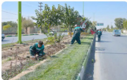
عملیات کاشت گل‌های فصلی بلوار امام خمینی (ره)