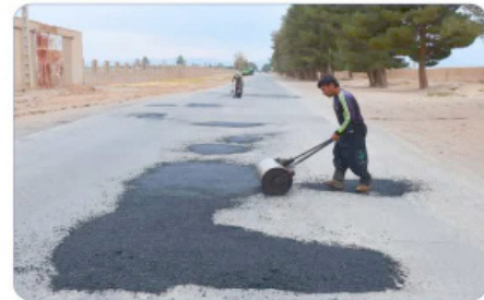
عملیات اجرایی لکه‌گیری آسفالت معا بر اصلی و فرعی سطح شهر